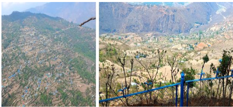
फोटो ६ : गाउँपालिकामा आवासको अवस्था

यो परिवेशमा सुरक्षित आवासको सङ्ख्या वृद्धि गर्नुपर्ने, वायु प्रदुषण कम गर्दै लैजानुपर्ने, प्रकोपबाट हुने मृत्यु र चोटपटक नियन्त्रण गर्दै जानुपर्ने, सम्पदा संरक्षण गर्नुपर्ने विषय यस लक्ष्यले समेटेको छ । सुनापति गाउँपालिकाको घरहरूको स्वामित्वमा आफ्नै स्वामित्व भएको ९८.५५ प्रतिशत रहेको छ । त्यसै गरि भाडाका घर १.१७ प्रतिशत, संस्थागत भवनहरू ०.१७ प्रतिशत, अन्य स्वामित्व ०.१२ प्रतिशत रहेको छ । पालिकामा ८५.२१ प्रतिशत घरधुरीहरूमा जग्गा तथा घर दुबैमा पुरुषहरूको स्वामित्व रहेको छ भने महिलाहरूको स्वामित्व घर तथा जग्गा दुबैमा ६.१५ प्रतिशत, जग्गा मात्रमा ७.३५ प्रतिशत र घर मात्रमा ०.७६ प्रतिशत रहेको छ । गाउँपालिकामा जग्गाको प्रकार अनुसार ८१.११ प्रतिशत घरहरू ढुङ्गा/ईट्टामा माटो जोडाई रहेको छ भने ढुङ्गा/ईट्टामा सिमेन्ट जोडाई १३.८१ प्रतिशत, आर.सि.सि .पिलर ४.१५ प्रतिशत, काठको पिलर ०.६९ प्रतिशत रहेको छ भने जग्गाको अन्य किसिममा ०.२४ प्रतिशत रहेको छ । बजार क्षेत्रहरूमा केही निर्माण संरचनाहरू पक्की भएता पनि अधिकांश क्षेत्रमा कच्ची संरचना नै रहेको छ । तसर्थ यस गाउँपालिकाको अधिकांश क्षेत्रहरूलाई शहरीकरण गर्न सकिएको छैन । तीव्र शहरीकरण नहुँदा अब निर्माण गरिने सार्वजनिक निर्माण तथा शहरीकरणलाई व्यवस्थित गर्न सहज भने हुने देखिन्छ । जसको कारण सुरक्षित बस्ती विकास, व्यवस्थित बस्ती विकास गरि शहरीकरणलाई व्यवस्थित गर्ने, सुरक्षित स्थानहरू पहिचान गरि सुरक्षित बस्ती तथा आवास निर्माण, विकासका दृष्टिले पछाडि परेका क्षेत्रलाई प्राथमिकता दिँदै सन्तुलित, वातावरण अनुकूल शहरीकरण गर्न सकिन्छ ।