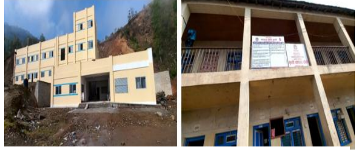
फोटो २ : सुनापति गाउँपालिकाको स्वास्थ्य संस्थाहरू

नवजात शिशु र पाँच वर्षमुनिका बालबालिकाको निवारण गर्न सकिने मृत्युलाई अन्त्य गर्ने लक्ष्य लिएको छ । स्वास्थ्य र समृद्ध जीवनको प्राप्ति एड्स, क्षयरोग, औलो र उपेक्षित उष्ण प्रदेशीय रोगहरू जस्ता महामारीको अन्त्यको लक्ष्य राख्दै र हेपाटाइटिस, पानीजन्य रोग र अन्य सरुवा रोगहरूको नियन्त्रण गरेर हासिल गर्ने लक्ष्य रहेको छ । नागरिकलाई स्वस्थ बनाउन आधुनिक चिकित्सा, आयुर्वेदिक, प्राकृतिक, होमियोपेथिक चिकित्सा क्षेत्र, स्वास्थ्य सुशासन र अनुसन्धानमा लगानी बढाउन आवश्यक देखिएको छ । स्वास्थ्य क्षेत्रलाई प्रभाव पार्न अर्को महत्वपूर्ण सुचक खाद्य सुरक्षा हो । आफ्नो उत्पादनले बाह्र महिना खाद्यान्न पुग्ने परिवार सङ्ख्या र बाह्र महिना भन्दा कम समयको लागि खाद्यान्न पुग्ने घरपरिवार सङ्ख्याले पनि व्यक्तिको स्वस्थगत अवस्थालाई निर्धारित गर्दछ ।