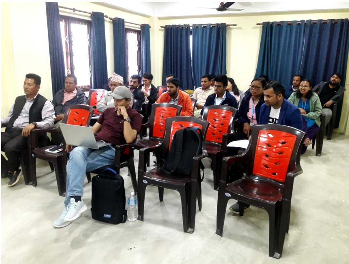
सुनापति गाउँपालिकाको दीगो विकास लक्ष्य स्थानीयकरण योजना तर्जुमा कार्यको कार्यशाला गोष्ठी