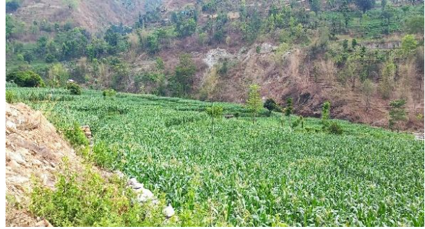
फोटो १ : सुनापति गाउँपालिकाको कृषि क्षेत्र

यस लक्ष्यले सन् २०३० सम्ममा भोकमरीको अन्त्य गर्ने र सुरक्षित, पोषणयुक्त र पर्याप्त खानामा सबै जनताको बर्षेभरी पहुँच सुनिश्चित गर्ने उद्देश्य लिएको छ । सुनापति गाउँपालिकामा व्यवसायिक तरकारी उत्पादनको लागि उपयुक्त हावापानी रहेको छ । यस क्षेत्रमा धान, मकै, गहुँ, कोदो, फापर जस्ता अन्नबालीहरूका साथै व्यवसायिक तरकारीबालीहरूमा आलु, गोलभेडा, काँक्रो, फर्सी, इस्कुस, प्याज, आदि उत्पादन हुने गर्दछ । गाउँपालिकामा कृषि क्षेत्र ५३.७३८ प्रतिशत रहेको छ । खेतीयोग्य जमिन मध्ये सबै भन्दा बढी वडा नं. ५ मा १,२२२.२५ हेक्टर तथा सबै भन्दा कम वडा नं. १ मा ६७१.७९ हेक्टर जमिन रहेको छ । कृषि फार्म ३८ वटा रहेका छन् । सुनकोशी नदि, चौरी खोला, खानी खोला, कामा खोला, घट्टे खोला, ठाडो खोला लगायतका खोलाबाट सिंचाई सुविधा उपलब्ध भईरहेको छ । सीमित कृषियोग्य जमिन, सिंचाई र अन्य कृषि सामग्री अभाव, तालिम र ऋणमा कमजोर पहुँच आदि जस्ता कारणहरूले गर्दा कृषिको खासै विकास हुन सकेको छैन ।