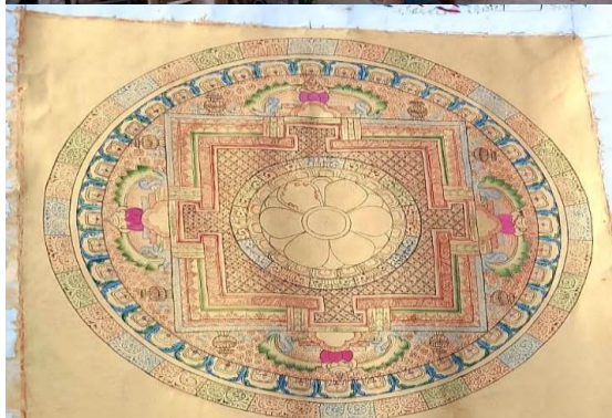
फोटो ४ : आर्थिक वृद्धिका माध्यम