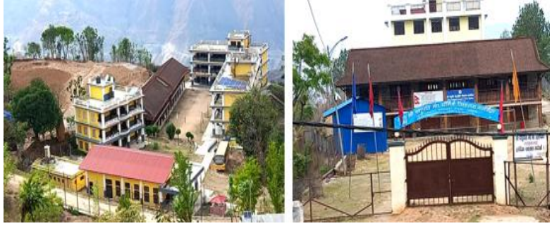
फोटो ३ : सुनापति गाउँपालिकाको शिक्षण संस्थाहरु

विज्ञान प्रविधि राष्ट्रको सामाजिक रुपान्तरण र आर्थिक विकासको प्रमुख सम्वाहक शक्ति मानिन्छ । गुणस्तरीय जीवनस्तर र सुशासन कायम गर्न एवम् सुरक्षा सुदृढ बनाउन समेत विज्ञान प्रविधिको उपयोग प्रभावकारी देखिएको छ । सुनापति गाउँपालिकामा शैक्षिक पूर्वाधारतर्फ २४ वटा आधारभूत विद्यालय र ९ वटा मा .वि.गरि जम्मा ३३ वटा सामुदायिक विद्यालय रहेका छन् । गाउँपालिकाको वडा नं मा रहेको २ . कृष्ण वर्णेश्वर क्याम्पस र सुनापति शहिद बहुमुखी क्याम्पस सञ्चालनमा छन् । वडा नं वटा २ बेथानमा ४ . विद्यालयमा नियमित पढाईको साथसाथै सिटिइभिटी अन्तर्गत कुशेश्वर माबेथानमा बाली विज्ञान र .वि. एको छ । मा कम्प्युटर साइन्स विषय पठनपाठन हुँदै आ.वि.डहु मासुनापति गाउँपालिका स्थित माहरुमा शतलिङ्गे.वि.श्वर मा .वि. (गुन्सी), अग्लेश्वर मा .वि. (दिमीपोखरी), कृष्णवर्णेश्वर मा .वि. (मानपुर), पशुपति मा .वि. (नागशिवा), डहु मा(डहु) .वि., कुशेश्वर मा) .वि.बेथान(, बाल मा(भिरकोट) .वि., कृष्णपुरी मा .वि. .वि.र जलदेवी मा (रुपाकोट) रहेका छन् । (खनियापानी)