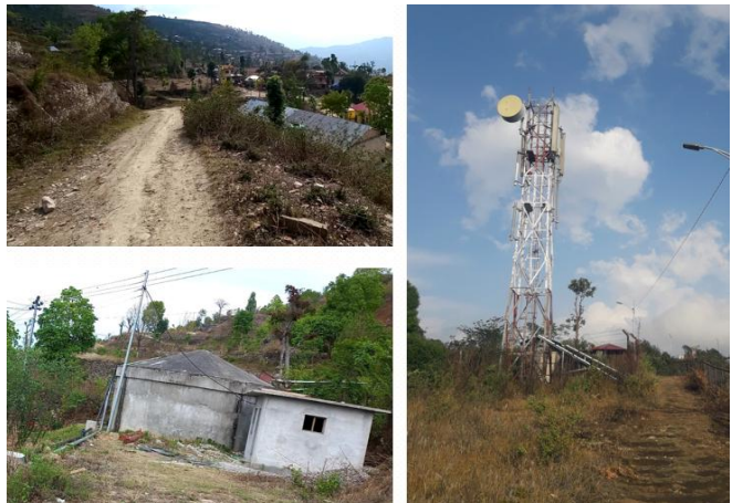
फोटो ५ : गाउँपालिकामा पूर्वाधारको अवस्था