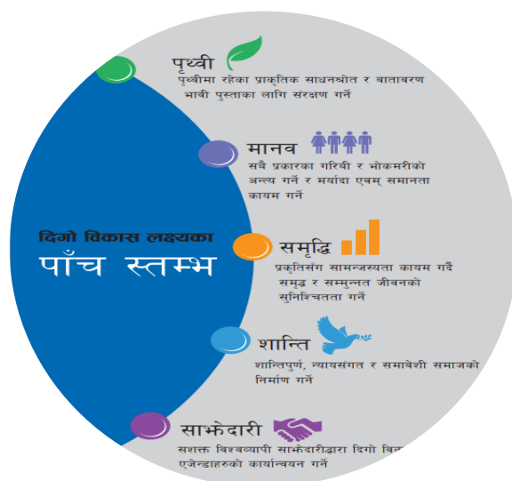
चित्र १ : दिगो विकास लक्ष्यका ५ स्तम्भ