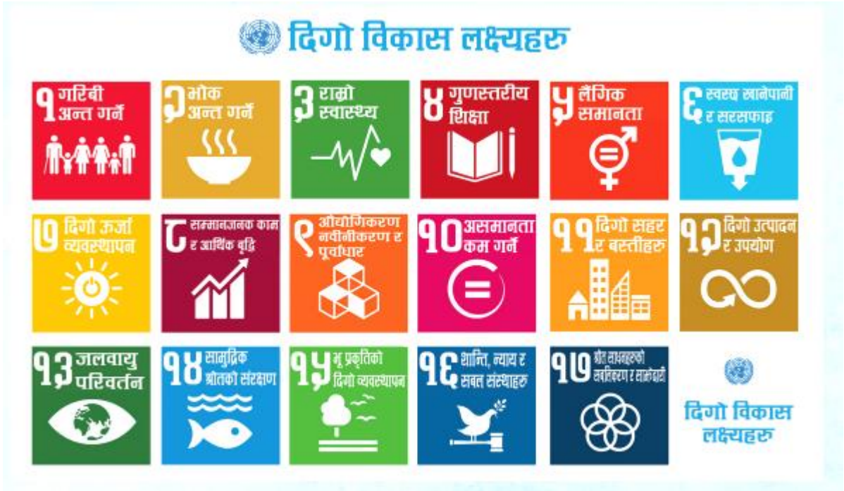
चित्र ३ : दिगो विकासका लक्ष्यहरू (१७ वटा लक्ष्यहरू)